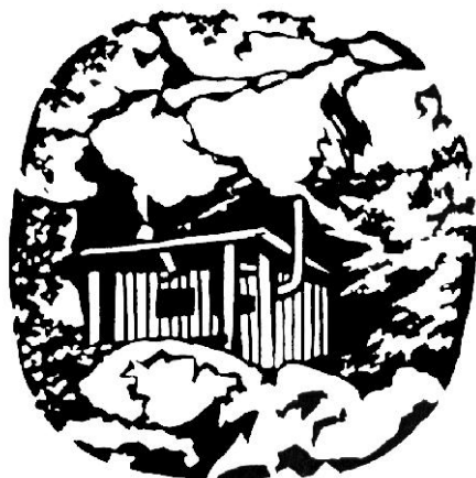
KT-03 Samarske stijene 1302 m

Prošlo je već jedanaest godina otkako je izdano treće izdanje vodiča, a u tom vremenu dogodile su se mnoge političke i društvene promjene u našoj domovini. Hrvatska je sada samostalna i neovisna država, što je izborila tijekom Domovinskog rata, a ti su događaji imali velik utjecaj na stanje i održavanje Kapelskog puta. Na svu sreću, rat nije neposredno zahvatio područje puta niti su stradali planinarski objekti, ali je prvih godina rata, tijekom 1991. i 1992., bio upitan prolazak oko Bijelih stijena zbog napete situacije u Jasenku. Srećom, to se već 1992. god. smirilo i od tada je obilazak KPP-a potpuno siguran.