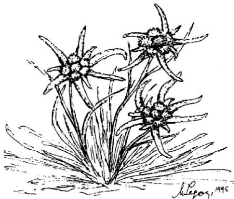
Runolist - kraški

prema jedinstvenom Velebitu. Tako smo 1984. g. istražili i označili spojni put (SPP) od Dulibe do Oltara, a 1985/86. kao plod prijateljstva i zajedničke ljubavi s dragim Senjanima, otvorili planinarsko sklonište u Krivom Putu. Tako su danas spojene dvije najljepše i najveće planine Hrvatske, Velebit i Velika kapela.