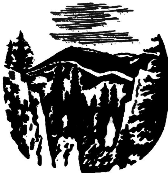
KT-02 Bjelolasica 1533 m

Iako cijelo područje Velike Kapele dobiva znatne količine oborina, postoji samo nekoliko stalnih tokova, odnosno potoka, koji poniru (Jasenački potok, Crni potok itd.). To se događa zbog propusnosti toga tla, kroz koje se voda gubi pukotinama u podzemlje. Poznato je, na primjer, da se Jasenački potok, koji ponire u jugoistočnom dijelu Jasenačkog polja, ponovno pojavljuje u Krakuru.