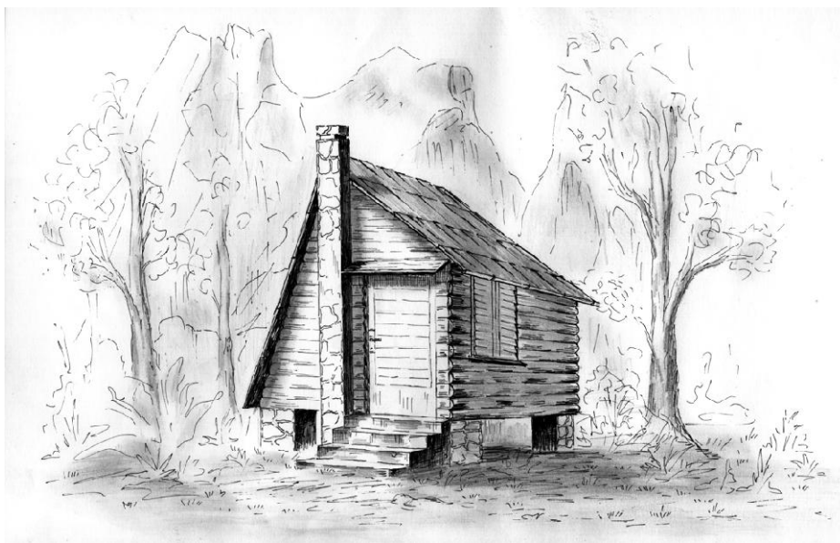
Staro sklonište na Bijelim stijenama (izgorjelo 1975. god.)