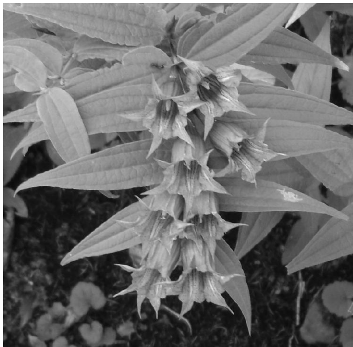
Plava sirištara ( gentiana asclepiadea )