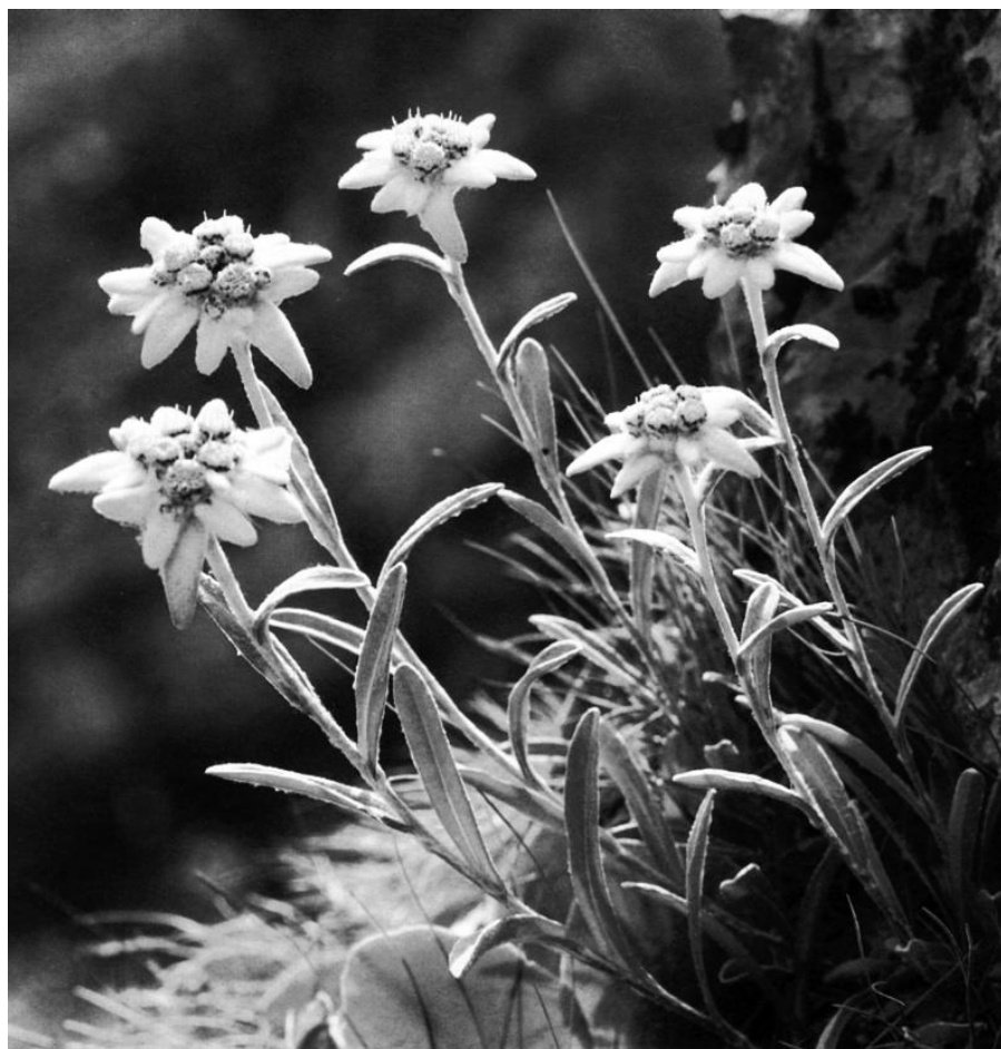
Runolist ( Leontopodium alpinum )

Velika Kapela zahvaća područje koje je omeđeno sa sjeverozapadne strane magistralnom cestom Zagreb — Rijeka, a s južne strane cestom Josipdol — Brinje — Vratnik — Senj. S istočne strane sklop prelazi u niz kraških polja (Ogulinsko, Oštarijsko, Plaško), dok se na zapadu obronci Kapele spuštaju prema moru. Unutar tih granica mogu se naznačiti tri usporedna gorska lanca koja zajedno čine sklop Velike Kapele. Istočni lanac počinje na sjeveru s Bjelolasicom (1533 m), kao najvišim vrhom čitavog sklopa, i proteže se preko Debelog vrha (1050 m) i Crnog vrha (1102 m) do prijevoja Vrata (888 m), preko kojeg prolazi spomenuta cesta Josipdol — Senj. Južno od tog prijevoja nastavlja se sklop Male Kapele. Srednji greben, zapadno od spomenutog, počinje kod Mrkoplja Čelimbašom (1089 m) te se nastavlja s Velikom i Malom Crnom kosom (1223 i 1163 m) na Samarske (1302 m) i Bijele (1335 m) stijene. Iza njih se lanac produžuje na Veliku Javornicu (1375 m), najvišu točku ovog niza, a zatim se nastavlja u smjeru Bijele grede (1103 m) i Bitoraja (1107 m), južno od Drežnice. Treći, najzapadniji lanac počinje s Burnim Bitorajem (1385 m) iznad Ličkog polja, obuhvaća Viševicu (1428 m), najvišu točku niza, te se produžuje preko Smolnika (1279 m) na Ričičko bilo (1286 m), sve do dugog grebena Kolovratskih stijena (1091 m), a završava