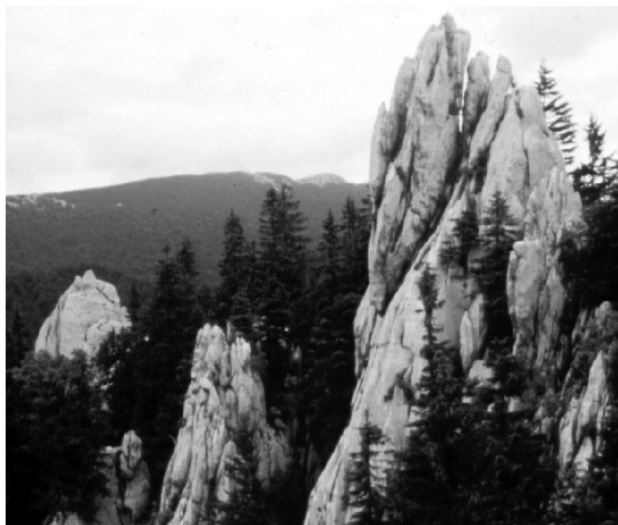
Bijele stijene - detalj oblika

Izuzetno lijepa poljana na oko 1030 m/nm. Na sjevernoj strani poljane nalazi se spomenik kojim se obilježila tragična smrt više pripadnika partizanske jedinice koja se po velikoj mećavi i niskoj temperaturi probijala 1944. god. iz Drežnice prema Tuku. To je niz kamenih gromada usađenih u zemlju, koje time simboliziraju kolonu boraca.