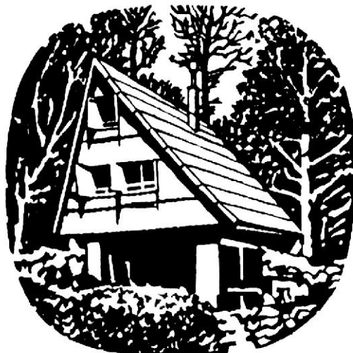
KT-05 Kuća na Bijelim stijenama 1335 m