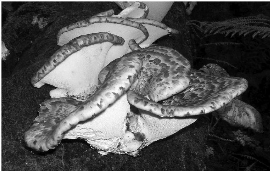
Škriplini na KPP-u ( Polyporus squamosus )