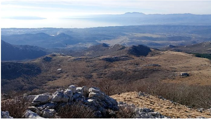
Pogled s vrha Treske 1233 metara