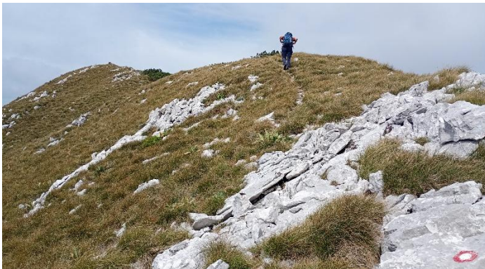
Vrh Planina 1426 metara

Od Malog doma na Platku smjerom Žute šetnice (šetnica Sleme) laganim hodoma cca 1 sat do kamenitog vrha Treska 1233 metra s prekrasnim vidicima na Kvarner, Učku i Grobničke Alpe. Povratak do Malog doma na Patku nastavkom Žute šetnice oko hrpta vrha Sleme 1327 metara cca 45 minuta.